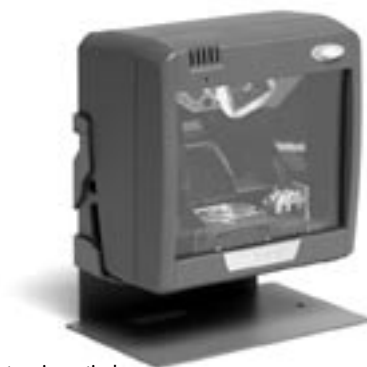
Kit di montaggio verticale

L'hardware EAS integrato funziona con i modelli Counterpoint IV, V, VI e VII disponibili presso Checkpoint® Systems.